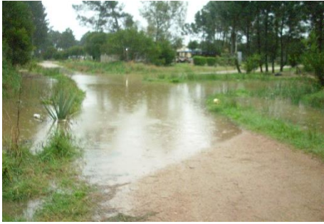
Fotografía 1 _ desbordes sistema actual

En consistencia con los postulados del drenaje sustentable se propone la construcción de una estructura de retención/laminación en el espacio público ubicado entre la Avenida República Argentina, Calle 3, Calle 32 y Calle 4, descargando posteriormente por los cancheros consecutivos mediante canalizaciones convencionales hasta la descarga actual.