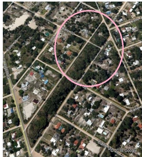
Fracción no intervenida

Se evidencia por parte de algunos pobladores gran apego al bosque ( ver informe DGG, Anexo) de pinos existente (fotografías 2 y 3), desinformación respecto al alcance de la propuesta (la propuesta comprende la remoción de unos 100 ejemplares) y desconfianza en relación a la capacidad de la IC de gestionar adecuadamente el espacio público.