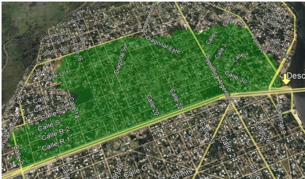
Imagen 1 – Cuenca Hidrográfica

De acuerdo a los lineamientos del Drenaje Sustentable, el estudio del drenaje se realiza en toda la cuenca hidrológica (Imagen 1). En función de los resultados se define la zona a intervenir (Imagen 2).